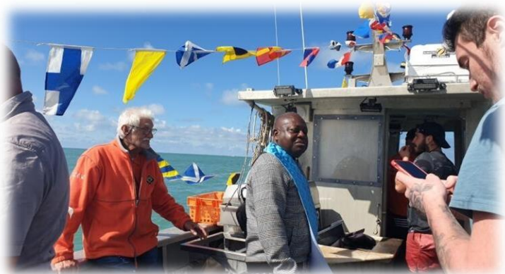
La bénédiction de la Mer