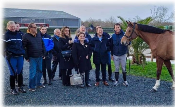
La garde républicaine au Centre équestre