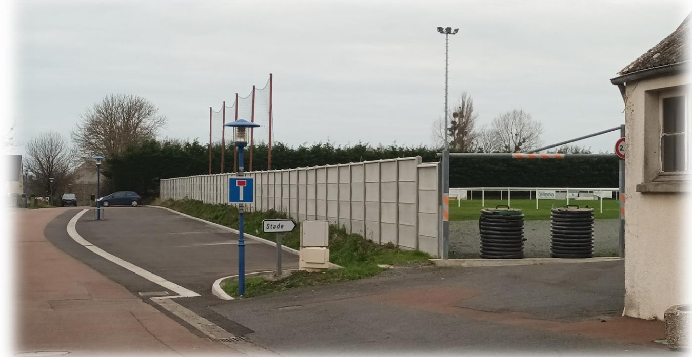
Parking Salle Guillon