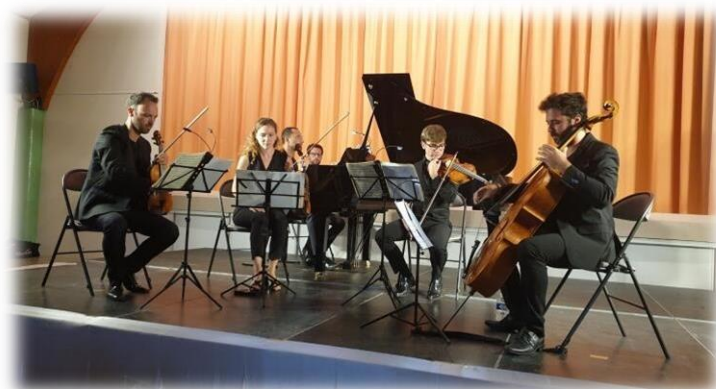
Le concert Varèse